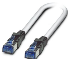
Kable połączeniowe, CAT6, wstępnie konfekcjonowane, 12,5 m

https://www.phoenixcontact.com/pl/produkty/2891369