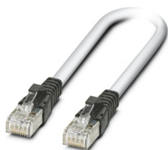
Kabel połączeniowy, CAT5, gotowy, 5 m

https://www.phoenixcontact.com/pl/produkty/2832580